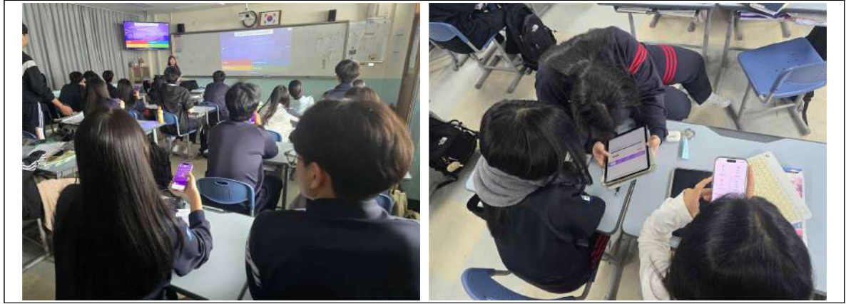
[사진 3] AI를 활용한 학습 정리 활동