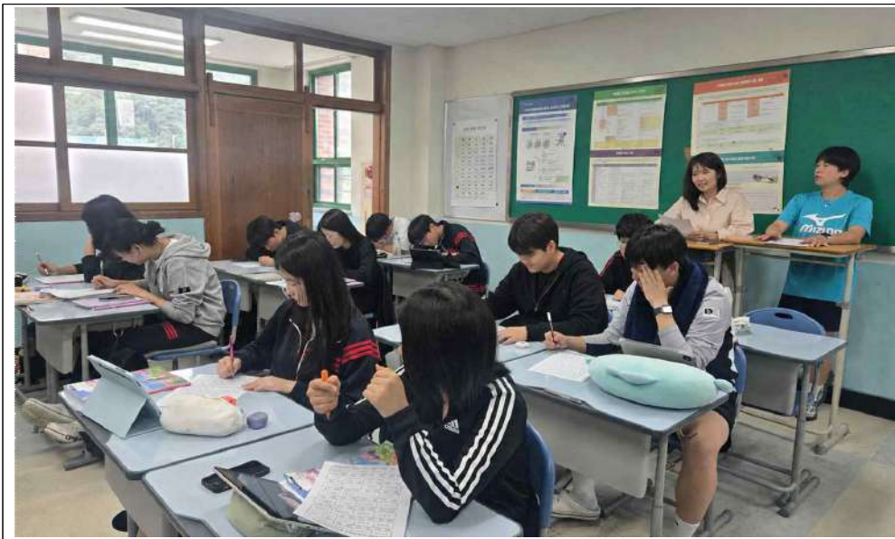
[사진1] 동료 교사의 적극적인 수업 참관 모습

통해 공개수업을 참관하며 학생들의 수업 참여 모습과 학교의 배움 중심 수업 운영 과정을 직접 살펴보는 시간을 갖는다. 학교는 이를 통해 교육공동체가 함께 수업을 이해하고 학교 교육에 대한 신뢰를 높이는 계기를 마련하고자 한다. 배귀애 교장은 “이번 수업나눔 주간은 교사들이 서로의 수업을 통해 배우고 성장하는 의미 있는 시간이 될 것”이라며 “앞으로도 전문적학습공동체와 연계한 지속적인 수업 나눔을 통해 학생 참여형 수업과 미래형 교육 실천을 더욱 확대해 나가겠다”고 밝혔다.