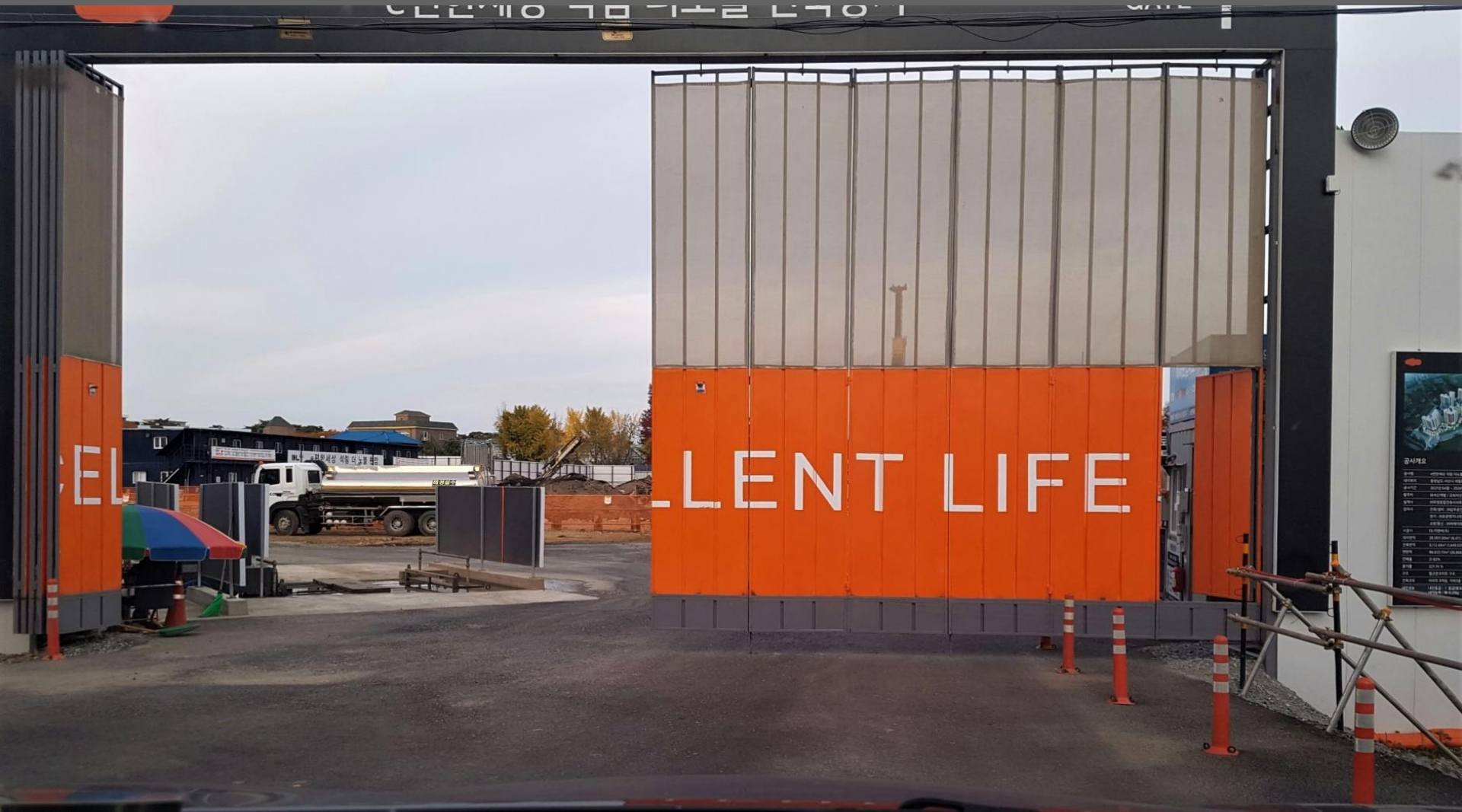
이성원 ( 서산중앙고등학교 미술 수석교사 )