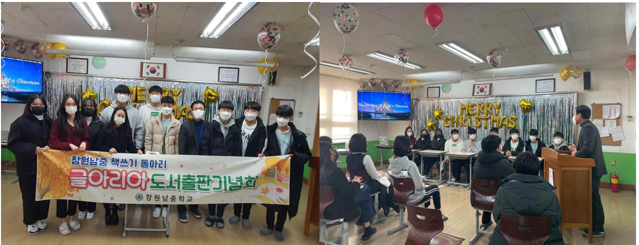
[사진설명-좌측] 글아리아 동아리 학생 전체 사진

코로나 19가 만 2년이 되어가는 2021년이다. 출판된 책 ‘우리’는 모두가 얼어있고 모두가 지쳐있는 지금까지지만 전 학년 등교 속에서 창원남중학교 학생이 이루어낸 작은 희망이다.