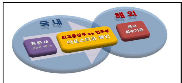
<아포스티유 확인 방식>