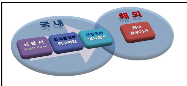
<기존의 영사 확인 방식>