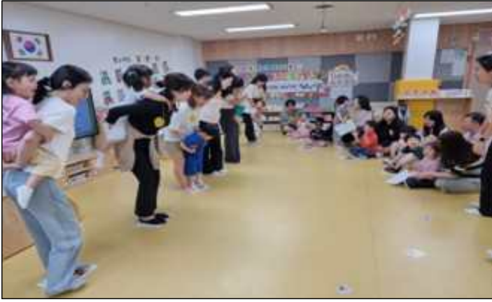
③ 참여수업 후 학부모들이 '내 아이의 손'을 찾고 있는 모습